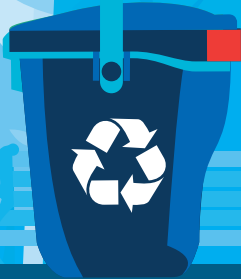
پیپر کارڈ بورڈ